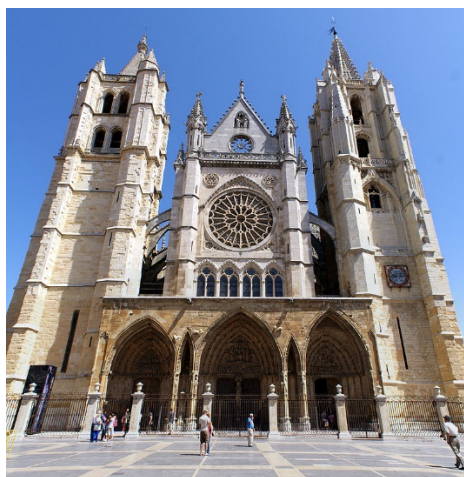
Imagen en Wikipedia. Lic. GFDL

Imagen en Wikipedia bajo dominio público