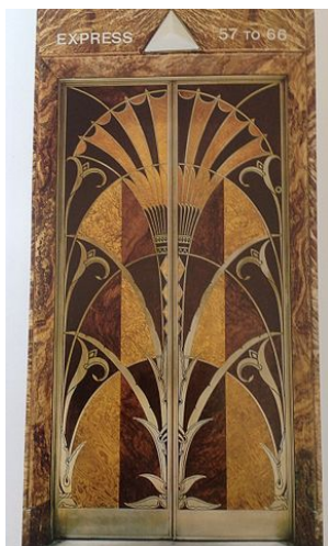
Imagen 1 en Wikipedia. Lic. CC BY – SA 4.0