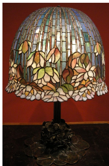
Imagen 4 en Wikipedia. Lic. GNU