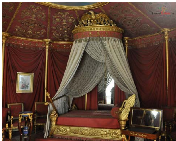
Imagen 2 en Wikipedia. Lic. CC BY-SA 3.0